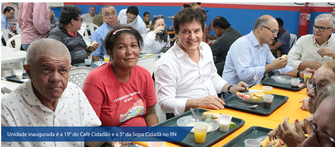
Unidade inaugurada é a 19ª do Café Cidadão e a 5ª da Sopa Cidadã no RN

Unidade da Avenida Rio Branco deve receber em breve também um Restaurante Popular