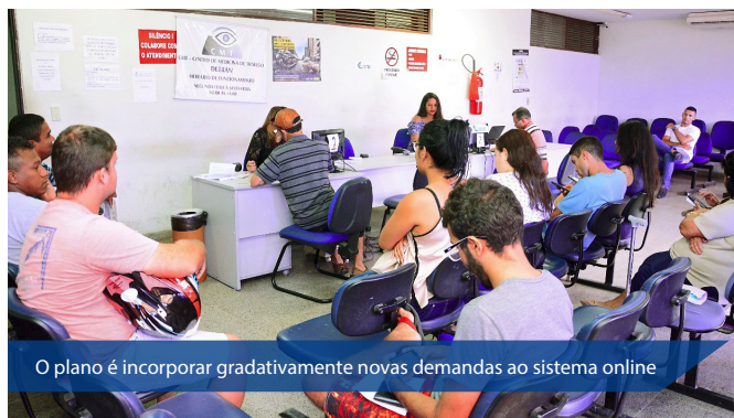
O plano é incorporar gradativamente novas demandas ao sistema online

A sala de abertura de processos de habilitação situada na unidade sede do Detran, no bairro de Cidade da Esperança, em Natal, que antes se mantinham com uma lotação rotineira, hoje é possível verificar uma ampla diminuição da permanência do usuário para resolver sua demanda. O motivo principal apontado por alguns servidores do Órgão que têm a responsabilidade de atender os usuários, está relacionada a abertura de processos via internet, o que resulta num tempo bem menor de retenção do cidadão na sala de habilitação, já que na abertura do serviço via internet ele adianta duas etapas do processo, inclusive já