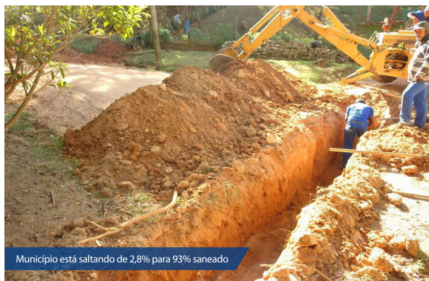
Município está saltando de 2,8% para 93% saneado

De acordo com o último senso demográfico, a população de "Gostoso" é composta por 8.670 pessoas e a renda média de mais da metade da população (53%) é de apenas um salário mínimo, com 67% da população vivendo na pobreza.