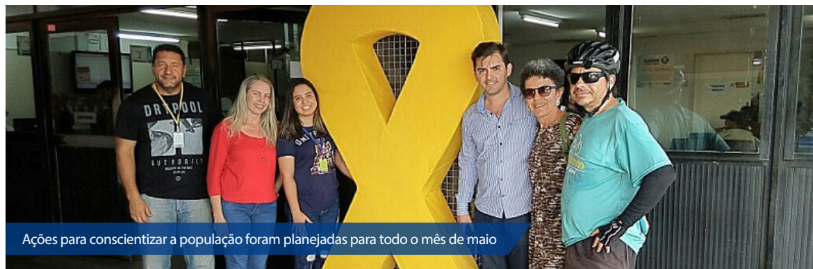
Ações para conscientizar a população foram planejadas para todo o mês de maio

Em Natal, a primeira ação acontece dia 9 de maio, no Hospital Walfredo Gurgel, com o uso da arte para uma ação de sensibilização comandada pelo Teatro Arte Inte-